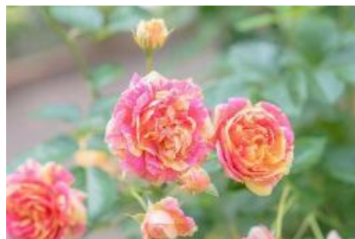
シンボルローズ「四季の香」

今年の秋のバラの見頃は、10 月中旬から 11 月中旬ごろの予定です。みなさまのご来園をお待ちしております。