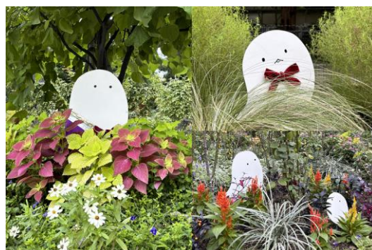
「おばけをさがそう」イメージ

※雨天中止、「おばけをさがそう」のプレゼントは仮装して参加した小学生以下各日先着100名様を対象です。