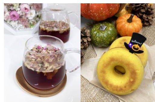
（左）ホットローズティー 400円（税込）