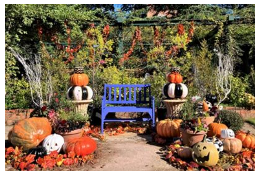
昨年のフォトスポット